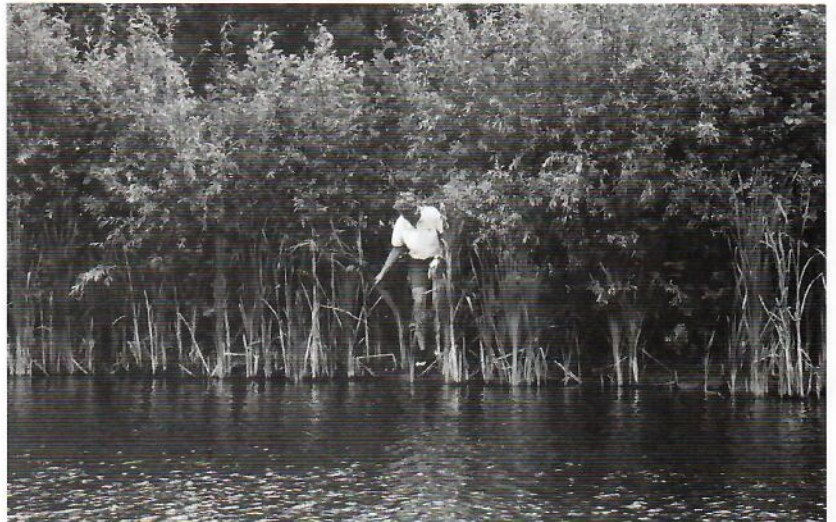
Zo dichtgegroeid was hole 16 in de afgelopen zomer