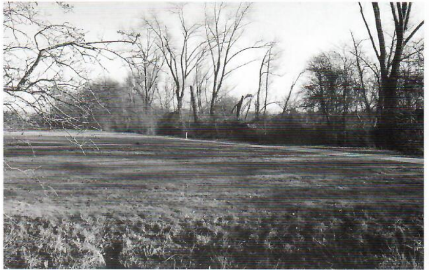
Gekapte bomen langs hole 12

Een machine is al gearriveerd en Arie is enthousiast genoeg om deze in de stromende regen naast de tee van hole 1 te rijden zodat we er een foto van kunnen maken. Een trotse hoofdgreenkeeper die het geheel naar zijn zin heeft op Amelisweerd en uitkijkt naar het voorjaar. Dan kan hij weer op de maaimachine: "er moet gras in die bak!"