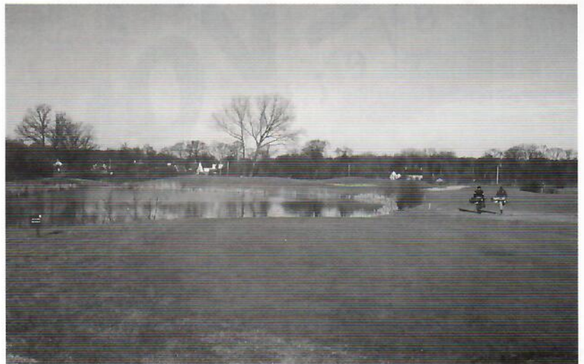
Hole 16 op dit moment